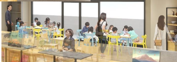
イベントにも活用できるスペース