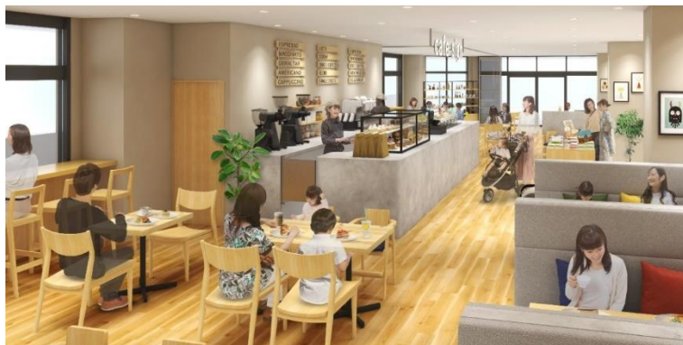
ブック&カフェのイメージ

健康館2階に、書店と、書店がセレクトした本や絵本のあるカフェ空間を設け、小さな子どもと一緒に気兼ねなく、居心地良く軽食や読書を楽しめるフロアにリニューアルします。小さなイベントスペースを併設し、定期的に子ども向けワークショップや健康づくりイベント等を実施し、作品を展示できるスペースも設置する予定です。