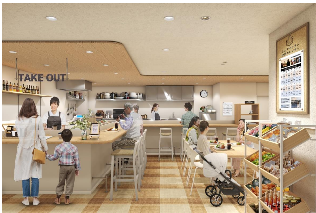
シェアキッチンのイメージ

2・3番館フードストリートの一角に、シェアキッチンを設置します。副業や飲食経営のトライアルなど、飲食店を始めてみたい方の夢をサポートします。また、「今日は何のお店かな？」と毎日のぞいてみたくなるような場所、仲良しの仲間が集いたいコミュニティの場を目指します。出店者の募集については、2024年夏頃より行う予定です。