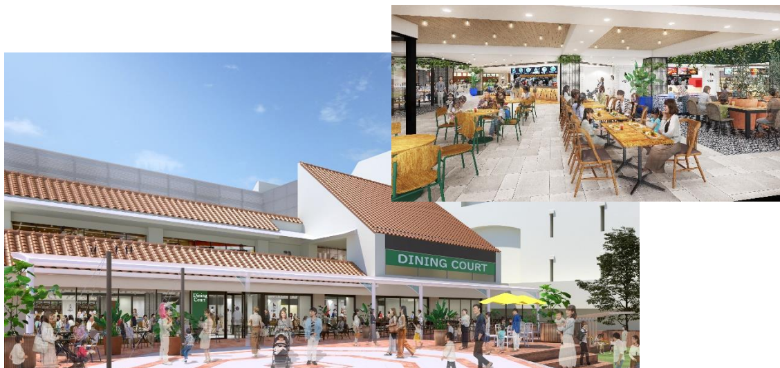
フードコート外観のイメージ

3番館1階には、待望のフードコートを新設します。ファミリー、お友達、おひとりさまなど幅広いお客様にお食事を楽しんでいただける店舗ラインナップや、過ごしやすい座席配置をおこないます。買物広場側に設置するテラス席では、開放的な雰囲気の中、ピクニック気分でお食事をお楽しみいただけます。