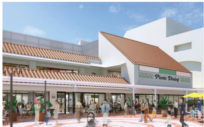
▲須磨パティオ フードコートテラス席（イメージ）